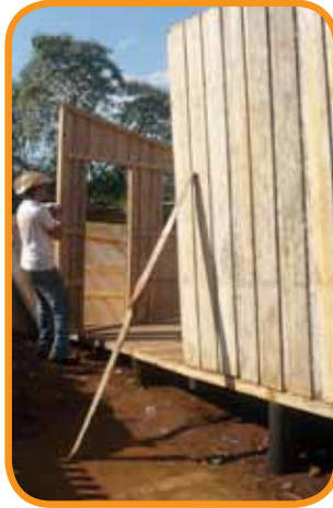
Beim Aufstellen und Befestigen der Wände

Die Phase nach dem Häuserbau ist oftmals die schwierigste mit einigen Rückschlägen. Einmal haben wir für die Familien einen „Koch- und Wie-er-nähre-ich-mich-richtig-Nachmittag“ organisiert. Weil es leider an diesem Tag geregnet hat, kamen wenige Familien. Das ganze Viertel war im Schlamm versunken und diejenigen, die keine Gummistiefel haben, sind zuhause geblieben und