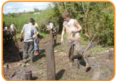
Manchmal war es auch eine schlammige Angelegenheit

Obwohl wir zu diesem Zeitpunkt schon zwei oder drei Monate in Argentinien waren, hatte bis dahin noch keiner von uns diese extreme Armut gesehen, die dort vorherrscht. Da hier in Argentinien alles ziemlich grünt und blüht, bemerkt man diese Armut anfangs nicht. Als wir dann gesehen haben, wie die Familien in Holzhütten auf nacktem Boden leben und Wände und Dach undicht sind, haben wir alle ziemlich schlucken müssen.