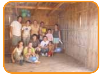
Einweihung des Hauses

Das Schönste für mich jedoch war, dass sie 37 Pesos (umgerechnet ungefähr 6 Euro) gespart und für das Projekt gespendet haben. Obwohl sie selbst nichts haben, wollen sie anderen Familien die Chance auf ein neues Haus geben. Da hier in Posadas das Projekt noch relativ klein ist, haben wir damals im Oktober für zehn Familien ein neues Zuhause bauen können. Über 120 Freiwillige haben bei dem Bau dieser zehn Häuser mitgeholfen. Der Großteil sind argentinische Studenten aus Posadas, die ihren benachteiligten Landsleuten auf die Beine helfen wollen, indem sie ihnen mit ihrer Arbeit zumindest ein solides Dach, einen Holzboden und stabile Wände bieten wollen.