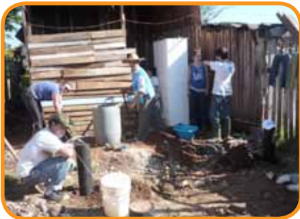
Eine Gruppe von Freiwilligen beim Einrichten der Pfähle, im Hintergrund das alte Haus der Familie

Seit 2009 werden auch hier in Posadas, der Provinzhauptstadt von Misiones, in zwei Elendsvierteln einfache Holzhäuser errichtet. Da unsere Vorgänger auch schon von diesem Projekt erzählt haben, waren wir MaZler neugierig und haben gleich beim ersten Konstruktionswochenende im Oktober mit angepackt.